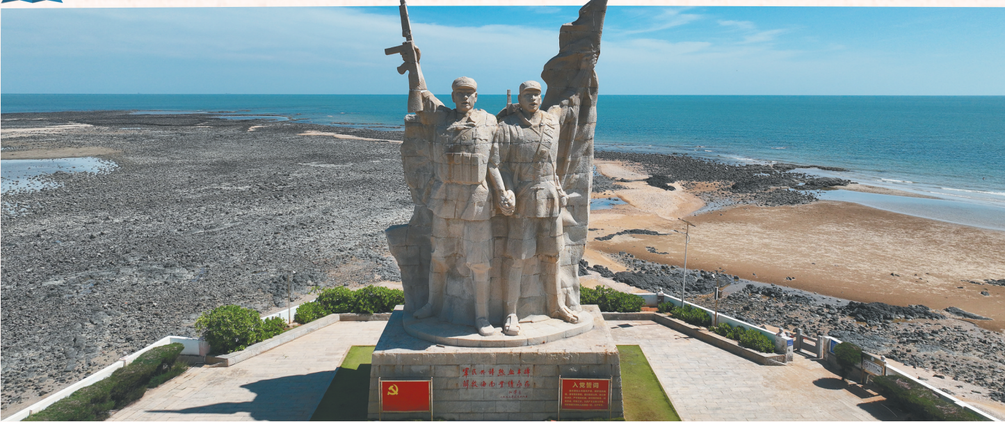
海南解放公园的“热血丰碑”雕像。