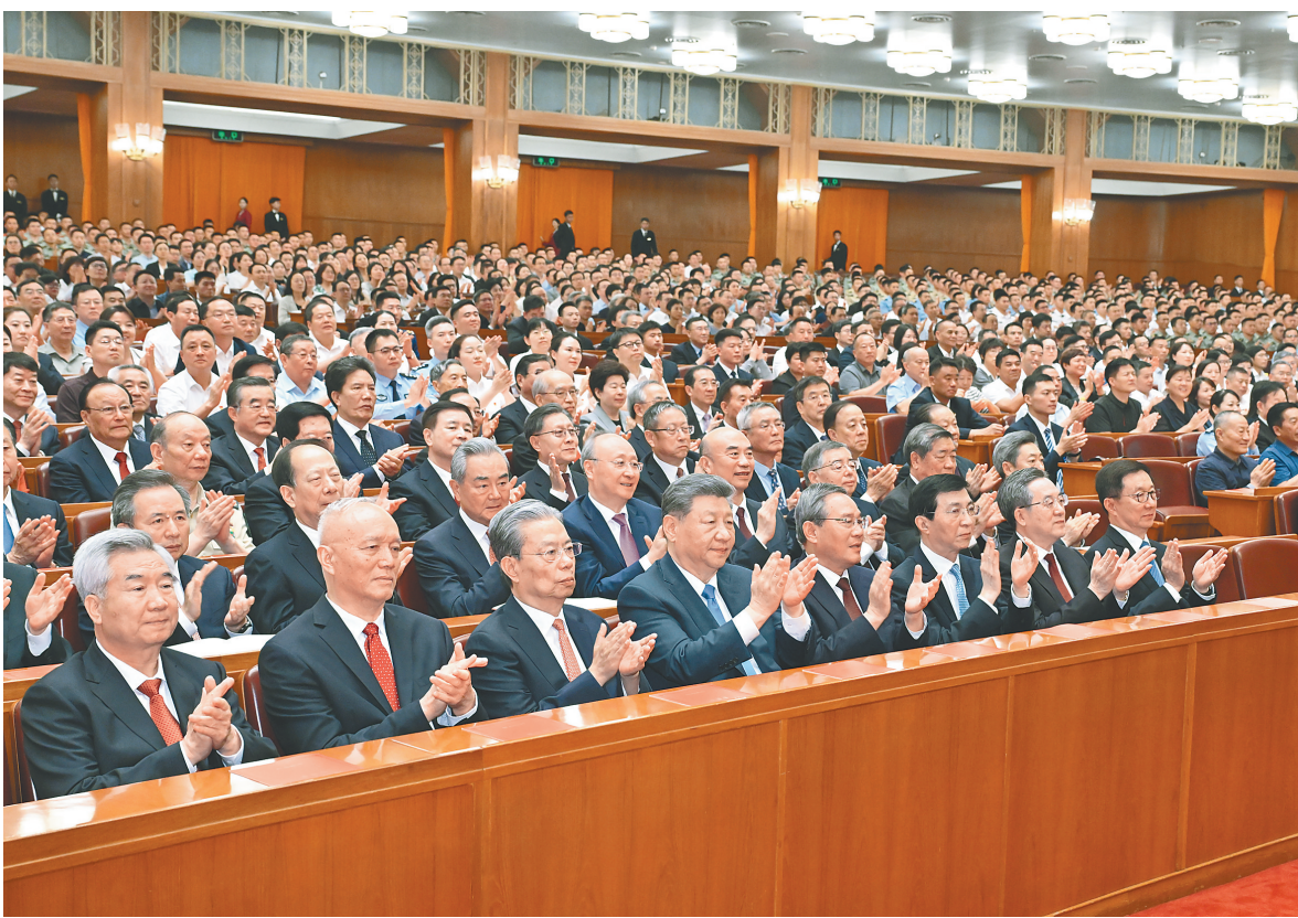
六月二十九日晚，庆祝中国共产党成立105周年音乐会《人民至上》在北京举行。习近平、李强、赵乐际、王沪宁、蔡奇、丁薛祥、李希、韩正等党和国家领导人，同约3000名观众一起观看演出。

新华社北京6月29日电 深情乐章致敬辉煌历程，嘹亮歌声唱响人民史诗。庆祝中国共产党成立105周年音乐会《人民至上》29日晚在京举行。习近平、李强、赵乐际、王沪宁、蔡奇、丁薛祥、李希、韩正等党和国家领导人，同约3000名观众一起观看演出，共同庆祝这个光辉的节日。 人民大会堂华灯璀璨，洋溢着喜庆的气氛。19时55分，在欢快的乐曲声中，习近平等党和国家领导人来到音乐会现场，全场响起热烈的掌声。 “唱支山歌给党听，我把党来比母亲……”伴着清亮的童声合唱，音乐会拉开帷幕。演出分为五个乐章，文艺工作者们以精湛的演奏、动人的歌声，表达对党的无限热爱，唱响民族复兴的时代强音。