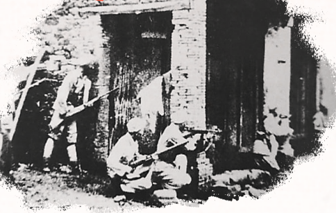
1950年4月21日,美亭决战中的黄竹巷战。(资料图)