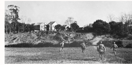
美亭决战中,解放军战士突破防线,向纵深发起进攻。(资料图)