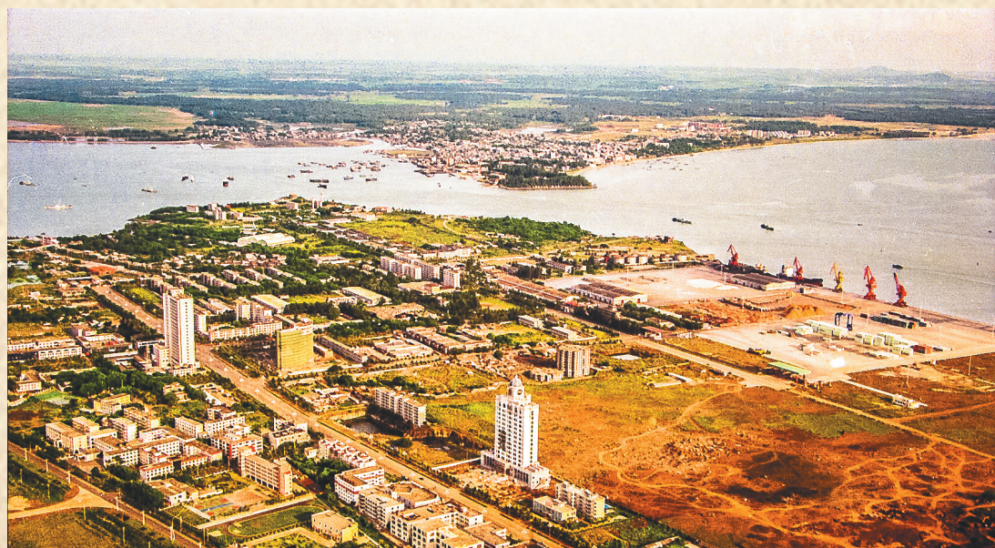
1987年，正在建设的洋浦港。