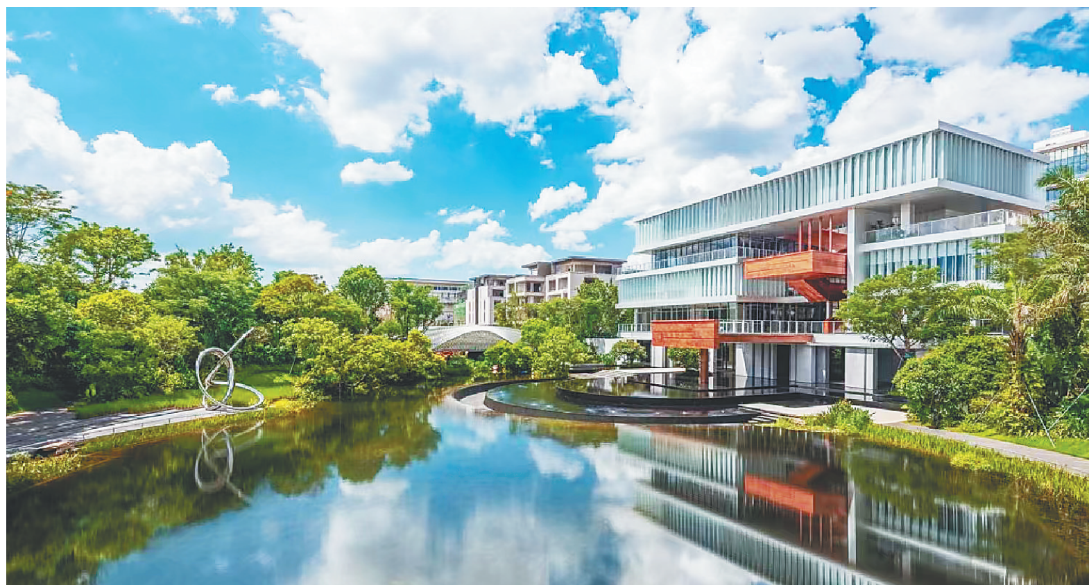
海南生态软件园AOC科技企业加速器。