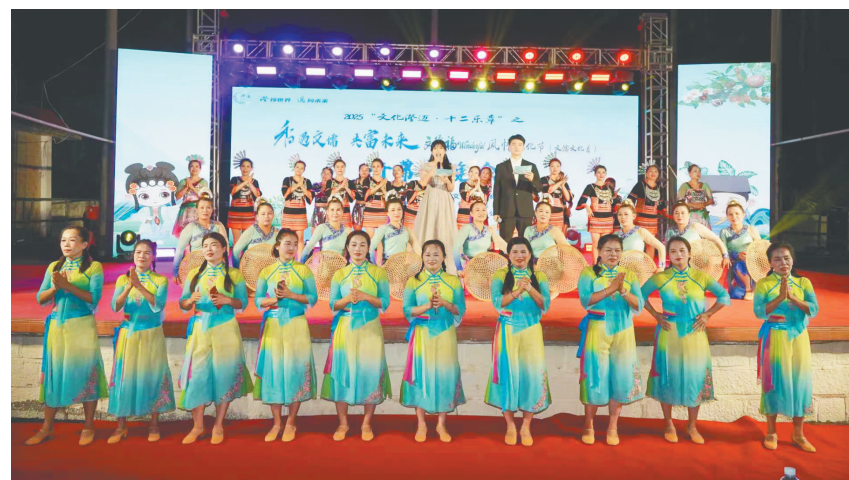
“文化澄迈·十二乐章”之文儒文化月。