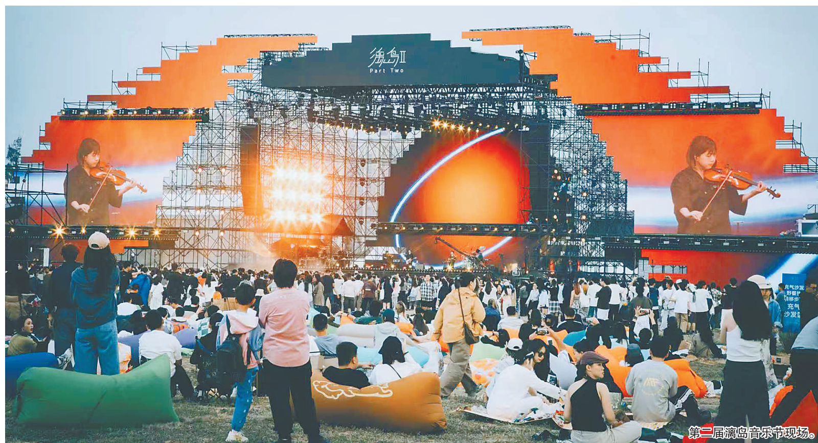
第二届离岛音乐节现场。

从东坡文化的千年回响，到音乐节的青春律动，再到雷公马动画的全国荧幕之旅，澄迈用“文化+旅游+影视”的融合模式，构建起多层次、多维度的文化IP矩阵，让这座城市既有历史的厚重，又有青春的活力。