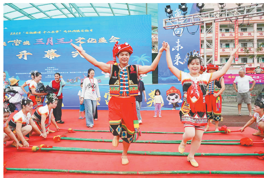
“文化澄迈·十二乐章”之仁兴镇“三月三”文化节。

数据显示，“文化澄迈·十二乐章”已开展多场活动，覆盖群众超30万人次。与此同时，澄迈健全了“政府主导、社会参与、基层落地、群众共享”的文化惠民机制。全县已建成12个“城市会客厅”、28个乡村文化驿站，培育50支非遗传承队伍。在全县11个镇高标准打造东坡书房、盘活咖啡店、沉香体验馆、共享农庄等载体，推动阅读场景与市民生活深度融合。精心举办的春节联欢晚会、“红色文艺轻骑兵”、春风村雨等系列文化下乡惠民活动，让优质文化资源直达基层。