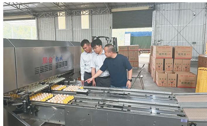
海南农商银行工作人员走访小微企业。