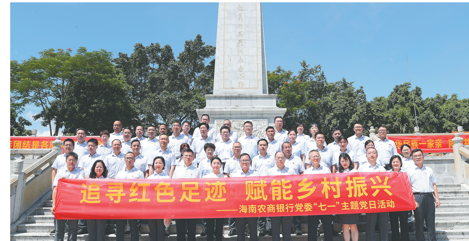
海南农商银行党委开展“七一”主题党日活动。

通过持续不断的政治引领和思想淬炼，全行上下筑牢了高举旗帜、听党指挥、忠诚担当的思想根基。深入贯彻自贸港先锋行动，着力推进“四强”党支部创建。持续巩固开展“堡垒强基行动”，将内控合规、反洗钱、员工异常行为管理和案件防控等相关内容纳入支部学习议程，强化支部党员和员工的纪法意识和合规意识。