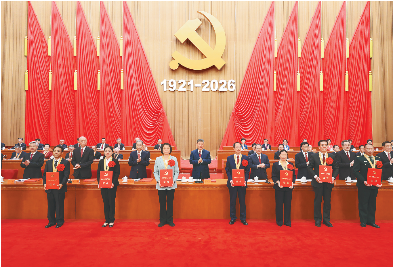
7月1日上午,庆祝中国共产党成立105周年大会在北京人民大会堂隆重举行。这是习近平等党和国家领导人为受表彰的全国“两优一先”代表颁奖。

习近平强调,实现新时代新征程党的使命任务,要求全体中国共产党人坚定信心、接续奋斗,不断创造无愧于时代和人民的新业绩。坚定信心、接续奋斗,必须坚持党的基本理论、基本路线、基本方略,坚持党的全面领导和党中央集中统一领导,深入贯彻新时代中国特色社会主义思想,坚定道路自信、理论自信、制度自信、文化自信,继往开来、守正创新,做到不畏浮云遮望眼、乘风破浪不迷航。必须紧紧依靠人民创造历史伟业,践行以人民为中心的发展思想,充分激发亿万人民的积极性主动性创造性,统筹推进“五位一体”总体布局、协调推进“四个全面”战略布局,完整准确全面贯彻新发展理念,加快构建新发展格局,扎实推动高质量发展。必须积极应对前进道路上的风险挑战,强化忧患意识、坚持底线思维,发扬斗争精神、增强斗争本领,更好统筹国内国际两个大局,统筹发展和安全。必须持续推动构建人类命运共同体,高举和平、发展、合