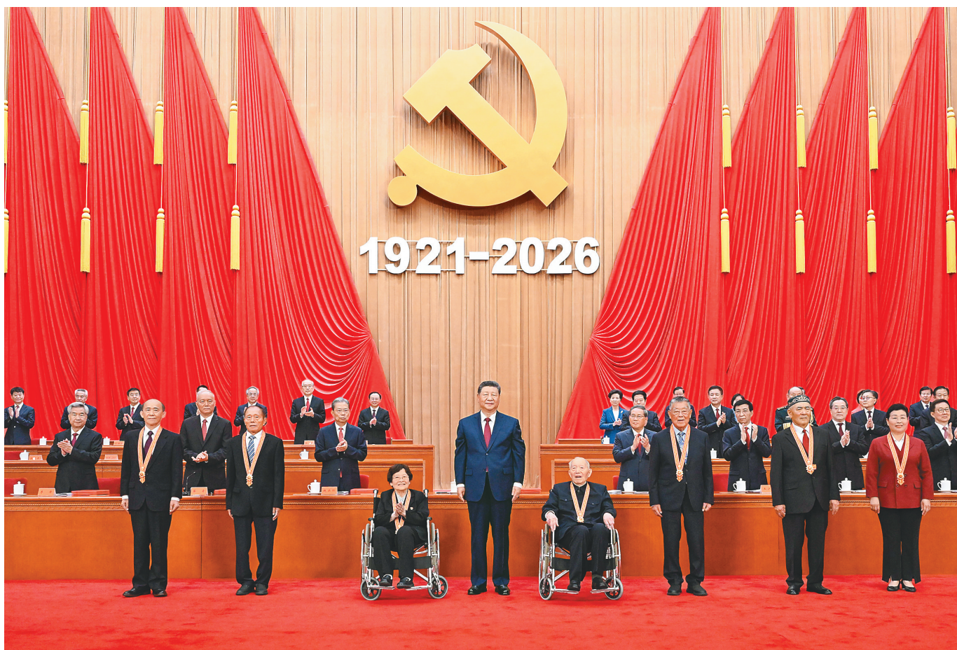
7月1日上午,庆祝中国共产党成立105周年大会在北京人民大会堂隆重举行。中共中央总书记、国家主席、中央军委主席习近平向“七一勋章”获得者颁授勋章。

新华社北京7月1日电 庆祝中国共产党成立105周年大会7月1日上午在北京人民大会堂隆重举行。中共中央总书记、国家主席、中央军委主席习近平向“七一勋章”获得者颁授勋章并发表重要讲话。他强调,105年来,我们党始终坚守为中国人民谋幸福、为中华民族谋复兴的初心使命,在不懈奋斗中创造了彪炳史册的伟大成就。新征程上,全党同志要坚定信心、接续奋斗,不断创造无愧于时代和人民的新业绩。