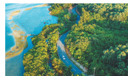
陵水黎族自治县新村镇南湾村公路。

观世界，海南两个枢纽加速“链”全球。港口布局持续优化，形成洋浦国际枢纽海港、海口全国主要港口，八所、三亚、清澜地区性重要港口的“四方五港”协同发展格局。依托“中国洋浦港”船舶港、保税油加注、“零关税”等自贸港核心开放政策，西部陆海新通道航空能级持续提升，国际航空枢纽影响力、竞争力持续放大；航空门户枢纽功能持续强化，海口美兰、三亚凤凰、琼海博鳌三大民用机场联动协同发展，持续用好第五、第七航权政策优势，开通全国首条第七航权客运航线，面向太平洋、印度洋的区域航空门户功能持续凸显。2025年，全省民航旅客吞吐量首次突破5000万人次。