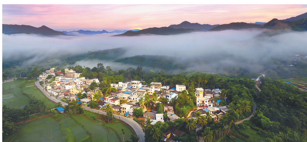
“四好农村路”建设加快推进，图为五指山市通什镇福关村公路。