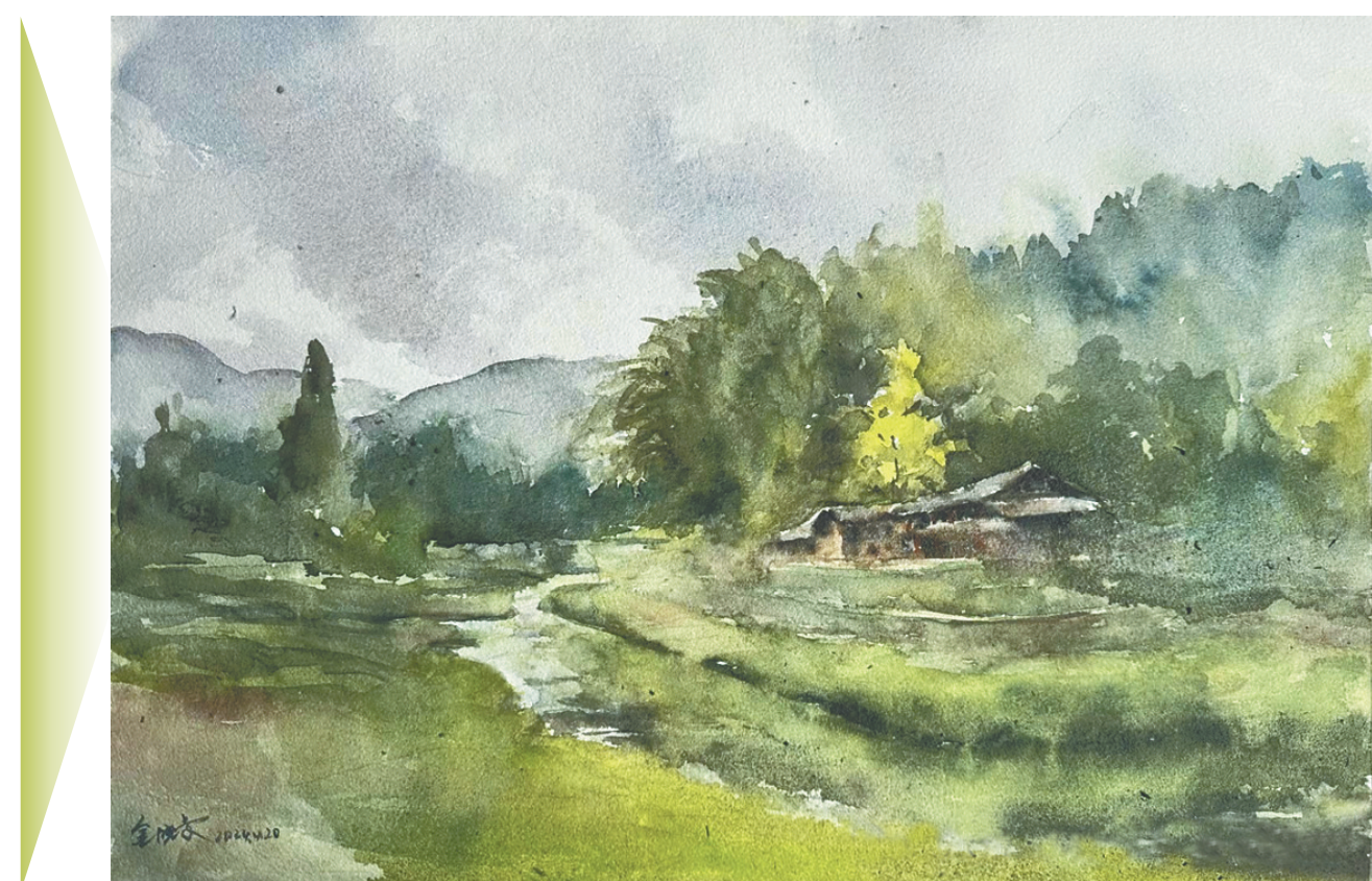
《雨中碧萝谷》（水彩） 金晓曼作

而今，赵奶奶，鱼奶奶，还有我奶奶，她们不在人世很多年了。李婶嫁到了城里，小巷里的很多人家都不似从前了，后来像我们这一代长大的孩子，还有后面的年轻人，像蒲公英一样，天涯海角，到处都有。