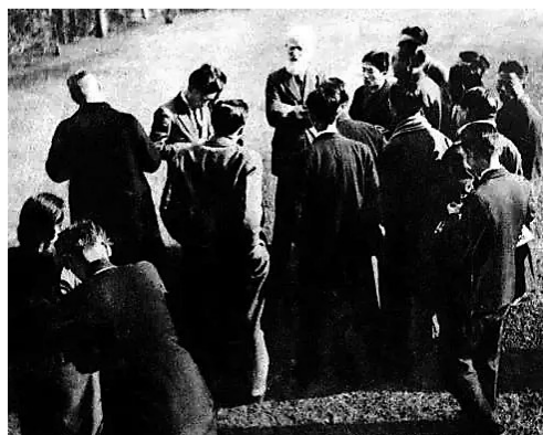
1933年，萧伯纳于上海宋庆龄寓所花园接受记者采访的情形。