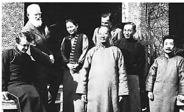
宋庆龄在寓所宴请萧伯纳。右起分别为鲁迅、林语堂、伊罗生、蔡元培、宋庆龄、萧伯纳、史沫特莱。