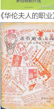
鲁迅与瞿秋白合作编辑的《萧伯纳在上海》，1933年3月由上海野草书屋出版。

1933年元旦的深夜，山海关的枪炮声揭开了长城抗战的序幕。此时，萧伯纳正在周游世界的豪华邮轮上，他想到中国游览长城。