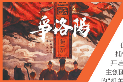
《三国第一部：争洛阳》海报。